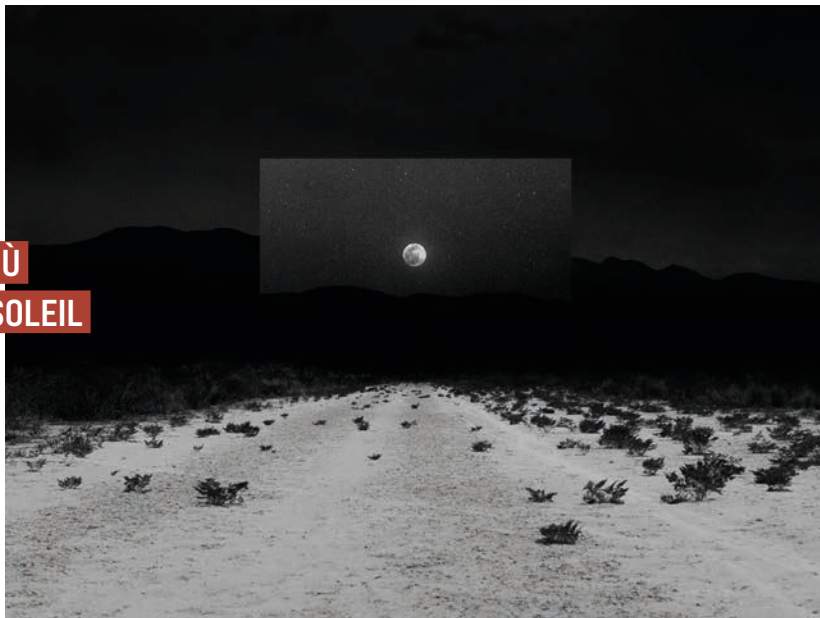
Après la cérémonie

Poursuivez le voyage avec l'expo événement du Centre du Patrimoine Arménien, présentée aux Rencontres d'Arles 2022