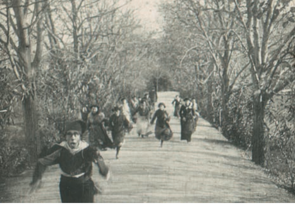
El heredero de la casa Pruna (1904)