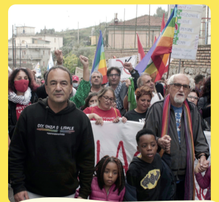
Un paese di resistenza